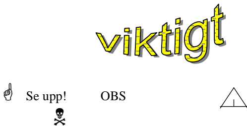
Figur 2 Ett urval uppmärksamhetsväckare:

Det finns en växande uppsättning allmänna uppmärksamhetsväckare. Se Figur 2.