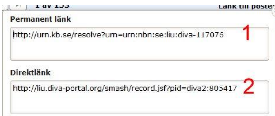
Bild 4. Länkar till posten.

Det finns två länkar till posten i DiVA. Den översta (nummer 1 i bild 4) är den permanenta länken som går via en resolver på Kungl. Biblioteket. Vi rekommenderar att användas den permanenta länken som länk till en post i DiVA. Direktlänken (nummer 2 i bild 4) går direkt till DiVA-posten och har inte samma stabilitet i ett längre perspektiv, till exempel vid flytt av databas, som den permanenta länken har. Använd inte direktlänken till DiVA, det är den permanenta länken som alltid ska användas.